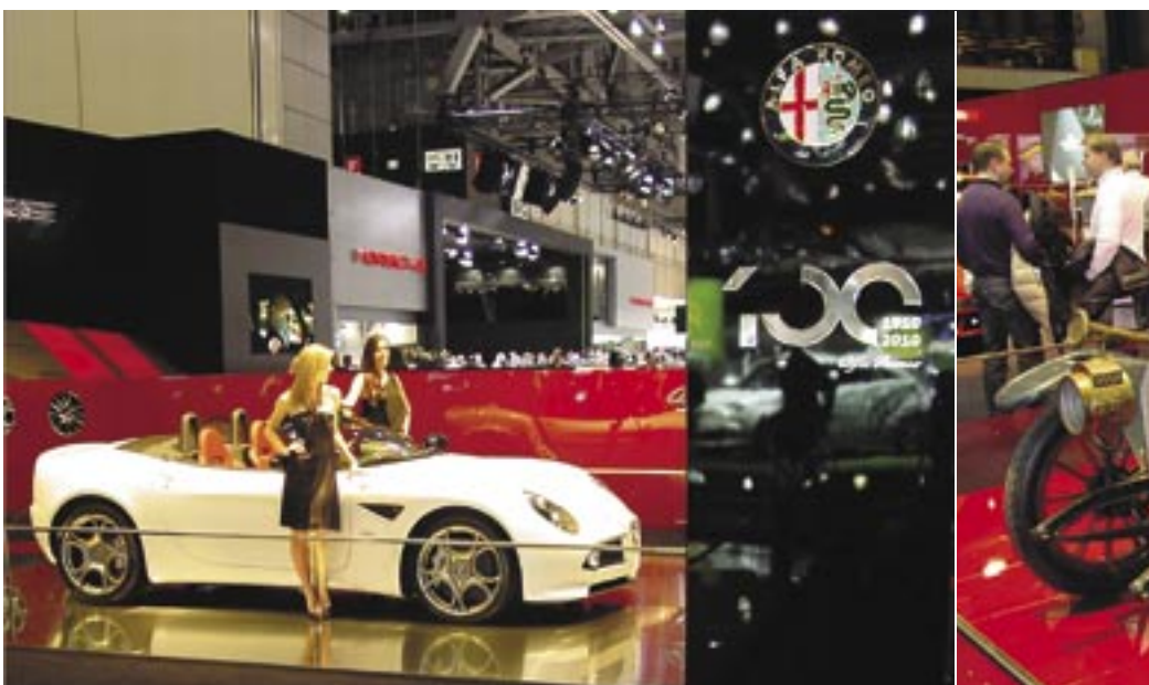
Stoleté jubileum firma Alfa Romeo připomínala na autosalonech v Ženevě i v Lipsku s dominantní (stylizovanou) číslicí 100.