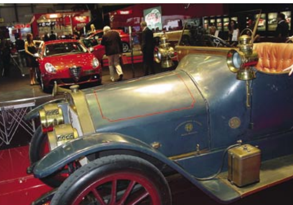
U osvětlených sběratelů i diváků se stále více prosazují trendy, že největší cenu i obdiv zasluhují autentické a nerestaurované exponáty, byť i nesou stopy používání či opotřebení.