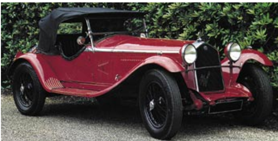
Atraktivní Alfa Romeo typu 6C 1750 s přeplňovaným šestiválcovým motorem a s karosérií roadster od věhlasné karosárny Zagato postavená roku 1934.

První Alfa vlastní konstrukce vyjela hned v roce 1910 a poháněl ji robustní čtyřválec zdvihového objemu 4084 ccm a o výkonu 45 koní. Ve verzi s lehkou otevřenou dvousedadlovou karosérií jeho hmotnost nepřevyšovala 1000 kg a dosahovala rychlosti 110 km/h. Dalším typem byl opět čtyřválec typu 4C ještě většího objemu a to 4492 ccm, ale již s ventilovým rozvodem 2xOHC a se čtyřmi ventily pro každý válec. Následovaly další čtyř