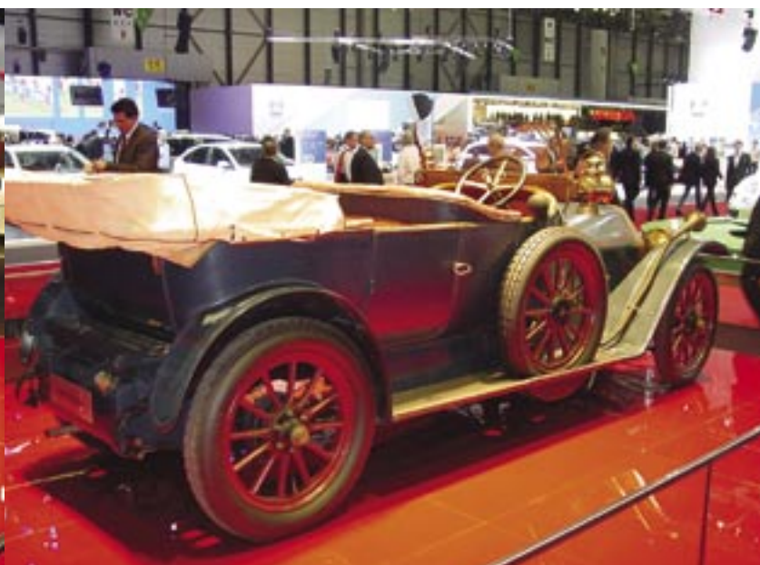
HP ročníku 1924 zahájila slavnou historii značky a automobil k nejcennějším exponátům továrního muzea v Arese u Milána.